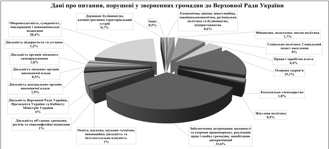
Дані про питання, порушені у зверненнях громадян до Верховної Ради України

252 електронні повідомлення, з них 63 після перевірки на відповідність встановленим законом вимогам оприлюднено Управлінням з питань звернень громадян як петиції для збору підписів, 190 — відхилено.